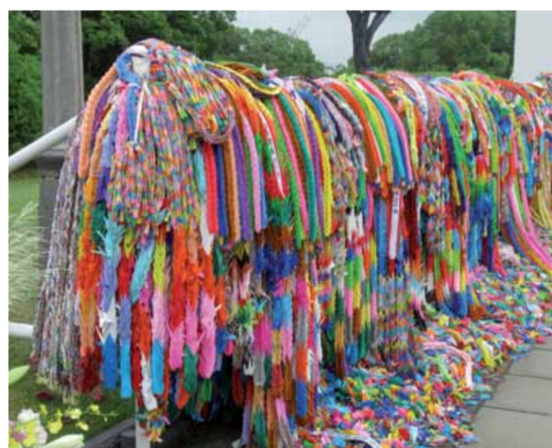
Papierkraniche in Hiroshima

Es ist ein Unglück, dass nach dem Zweiten Weltkrieg ein „UN-Sicherheitsrat“ statt eines UN Friedensrates geschaffen wurde – ich denke, schon damals steckte darin militärisches Denken und Kalkül statt eines Denkens und Handelns vom Frieden her, wie es die Charta der Vereinten Nationen vorsieht. Deshalb ist es richtig, dass diese „Sicherheitslogik“ nun von der Friedenswissenschaft und der Friedensbewegung in Deutschland durch das Konzept einer „Friedenslogik“ herausgefordert wird. Das Frauen Netzwerk für Frieden beteiligt sich an diesem Prozess in Anlehnung an die Botschaft im Friedenszettel auf der 4. Weltfrauenkonferenz 1995 (Peking/Huairou): „Change the Culture of War to a Culture of Peace“ - Friedenskultur statt Kriegskultur aufbauen! Denn unser Motto lautet: Kriege werden von Menschen gemacht. Frieden auch.