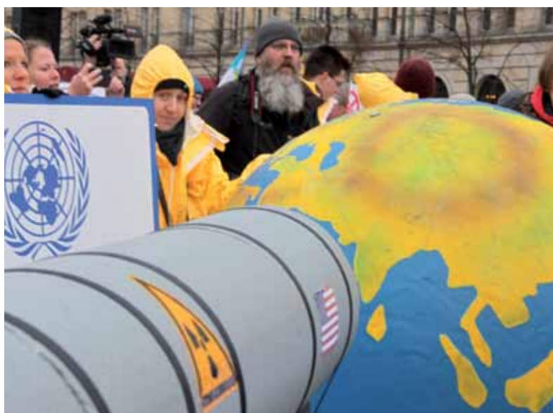
Menschenkette Stoppt die Eskalation - Atomwaffen ächten, Berlin 2017