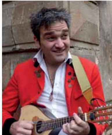
Prinz Chaos II.

► Ich bin gegen eine weitere Erhöhung des Rüstungshaushalts um zusätzliche 30 Mrd. Euro jährlich. Ich will nicht, dass 2 Prozent des BIP fürs Militär ausgegeben werden. Schon jetzt ist dieser Haushalt mit 38,5 Mrd. Euro der zweitgrößte. Unsere Steuergelder werden für Kriegswaffen und militärische Auslandseinsätze junger Menschen ausgegeben. Das ist nicht in unserem Interesse. Es ist im Interesse von Banken und Konzernen, die so billig an Ressourcen, Rohstoffe, Arbeitskräfte kommen um ihre Profite zu erhöhen. Ganze Länder werden ausgebeutet oder zerstört. Die Menschen flüchten vor Krieg, Terror, Zerstörung und Not auch nach Europa. Meine Vision ist ein Friedensstaat kein Rüstungsstaat.